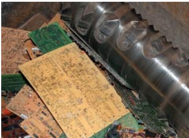
Vorzerkleinerung von Leiterplatten

Kupfer grob: Die erzielte Kupferfraktion ist durch die zahlreichen Bauelemente und Lötstellen auf der Leiterplatte mit Blei, Zinn und Zink vermischt. Diese Fraktion wird in Kupferhütten zu reinen Metallen weiterverarbeitet.